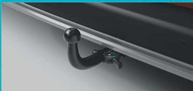
HAKI HOLOWNICZE / WIĄZKI