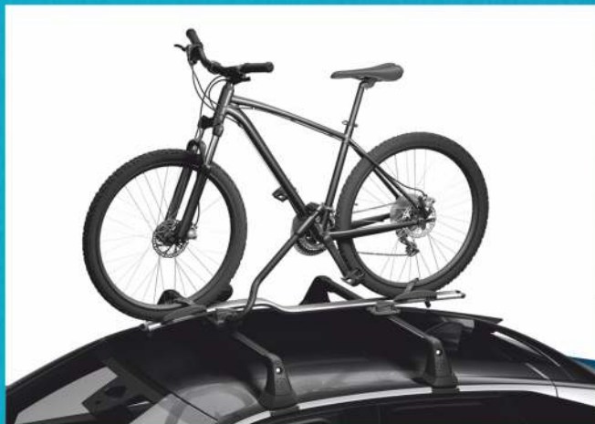
UCHWYTY DO PRZEWOZU ROWERÓW (MONTOWANE NA BELKACH POPRZECZNYCH BAGAŻNIKA DACHOWEGO)