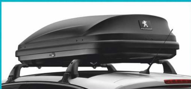
KUFROWE BAGAŻNIKI DACHOWE