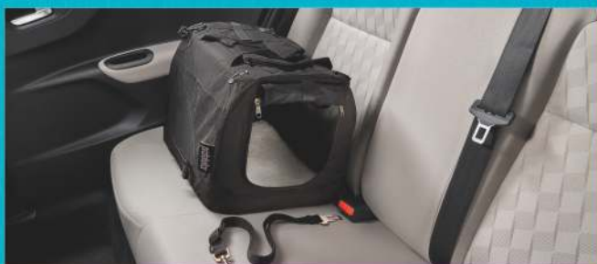
TORBY DO PRZEWOZU ZWIERZĄT