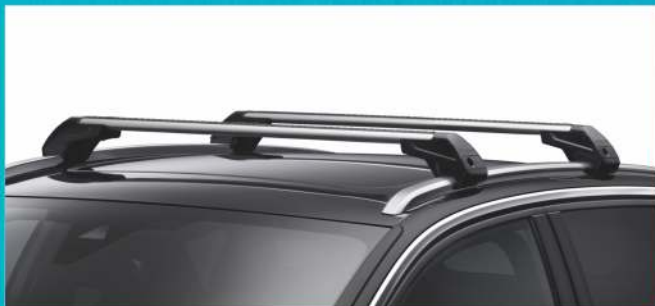
BELKI POPRZECZNE BAGAŻNIKA DACHOWEGO

Dzięki odpowiednio dobranym akcesoriom z naszej gamy, przewieziesz bezpiecznie, co chcesz i jak chcesz. Akcesoria te, solidne, estetyczne i łatwe w montażu, spełniają aktualne normy bezpieczeństwa i idealnie pasują do Twojego samochodu.