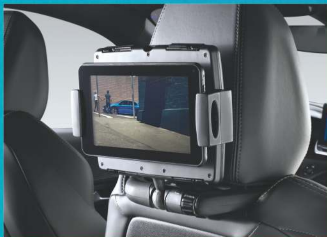
WSPORNIKI DO URZĄDZEŃ MULTIMEDIALNYCH

Promocja obejmuje wszystkie modele samochodów Peugeot. Skierowana jest do klientów indywidualnych. Szczegółowe informacje o ofercie dostępne są u Doradców Serwisowych Klienta.