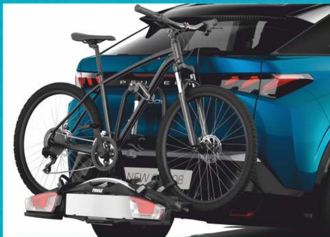
UCHWYTY DO PRZEWOZU ROWERÓW (MOCOWANE DO HAKA HOLOWNICZEGO)

Promocja obejmuje wszystkie modele samochodów Peugeot. Skierowana jest do klientów indywidualnych. Szczegółowe informacje o ofercie dostępne są u Doradców Serwisowych Klienta.