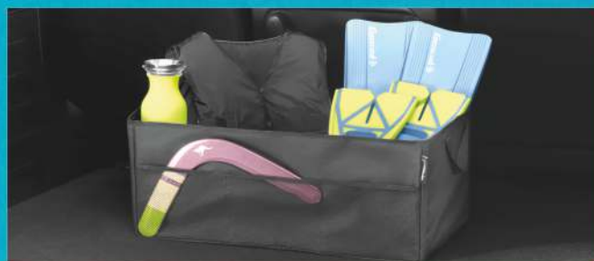
TORBY DO BAGAŻNIKA NA DROBNE PRZEDMIOTY

Promocja obejmuje wszystkie modele samochodów Peugeot. Skierowana jest do klientów indywidualnych. Szczegółowe informacje o ofercie dostępne są u Doradców Serwisowych Klienta.