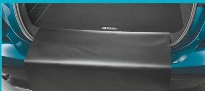
OŚLONY PROGU BAGAŻNIKA