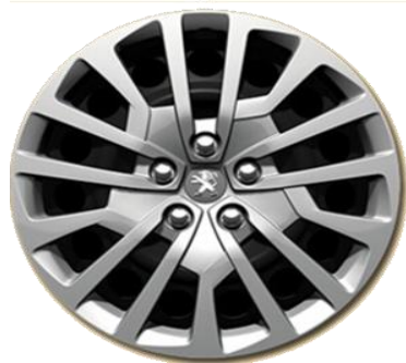
Kołpak na czarną felgę stalową 17" MIAMI