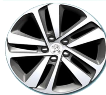
Felga aluminiowa 17"