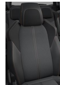
Tapicerka półskórzana Belomka Mistral