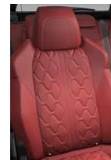
Tapicerka skórzana Nappa Rouge