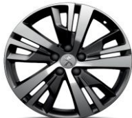
18" 'Detroit' Storm Grey