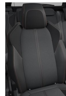
Tapicerka półskórzana Belomka Mistral