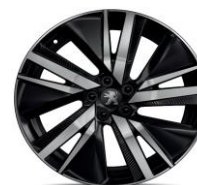
19" 'San Francisco'