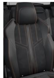
Tapicerka półskórzana Mistral + Alcantara