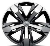
18" 'Los Angeles'