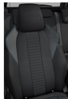
Tkanina Pneuma Mistral