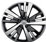
18" 'Detroit' Onyx Black