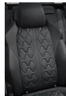
*Tapicerka skórzana Nappa Mistral