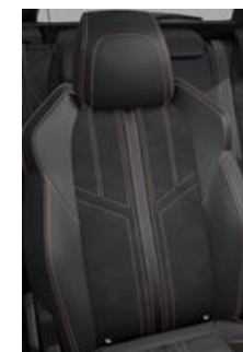
Tapicerka półskórzana Mistral + Alcantara