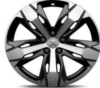
18" 'Los Angeles'