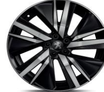
19" 'San Francisco'