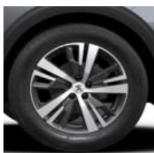
18" 'Detroit' Storm Grey