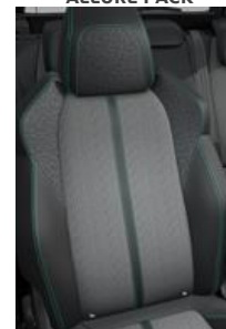
Tapicerka półskórzana Colyn Mistral