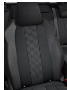
Tkanina Mecos Mistral