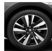
19" 'San Francisco'