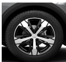
18" 'Los Angeles'