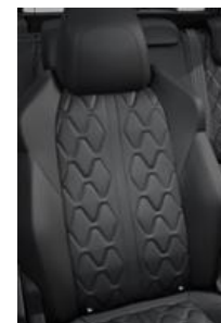
*Tapicerka skórzana Nappa Mistral