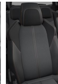
Tapicerka półskórzana Belomka Mistral