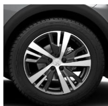
18" 'Detroit' Onyx Black