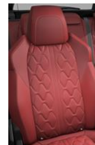
*Tapicerka skórzana Nappa Rouge