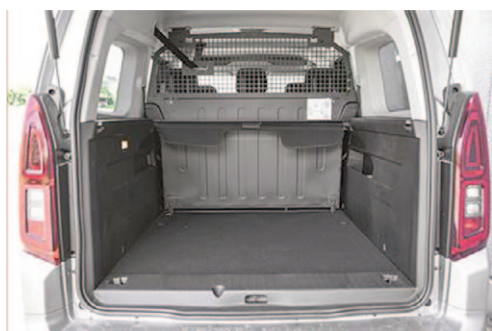
Przegroda stała za drugim rzędem siedzeń

SAE - norma obliczania całkowitej pojemności bagażnika (ile litrów płynu zmieści się w bagażniku). Z reguły pojemność bagażnika mierzona według metody SAE będzie większa od VDA.